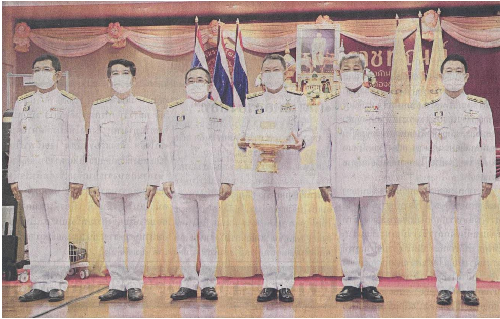
◀พระราชทาน...พระบาทสมเด็จพระเจ้าอยู่หัว ทรงพระกรุณาโปรดเกล้าฯ พระราชทานพระราชทรัพย์ส่วนพระองค์ 48,945,200 บาท ในการจัดหาอุปกรณ์ทางการแพทย์พระราชทานแก่กรมราชทัณฑ์ เพื่อรองรับและแก้ไขปัญหาการแพร่ระบาดของโรคโควิด-19

ข่าวประจำวันศุกร์ที่ ๒๘ พฤษภาคม ๒๕๖๔ หน้าที่ ๑