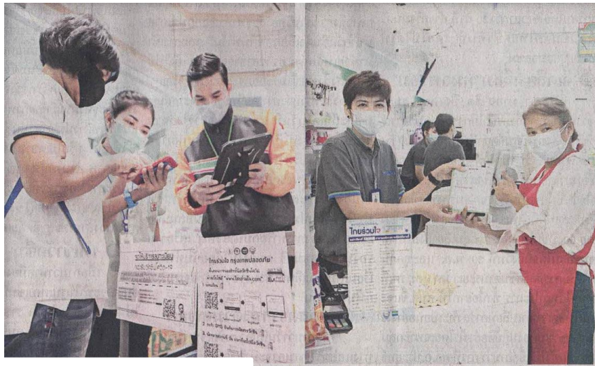
▲ จองวัคซีน... ประชาชนนำเอกสารต่อคิวยื่นแสดงหลักฐานเข้าจองฉีดวัคซีนป้องกันไวรัสโควิด-19 ที่ร้านเซเว่นอีเลฟเว่น สาขาพหลโยธิน 18 (ซ้าย) ส่วนที่แฟมิลีมาร์ท สาขาประชาราษฎร์บำเพ็ญ 11 เขตห้วยขวาง (ขวา) มีผู้สนใจนำเอกสารลงทะเบียนกันคึกคัก

ข่าวประจำวันศุกร์ที่ ๒๘ พฤษภาคม ๒๕๖๔ หน้า ๑